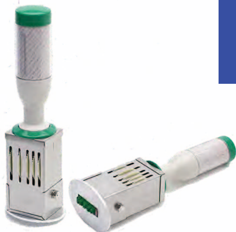
Bタイプ (文字が円に沿って配置のもの)