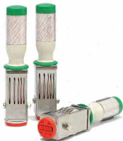
Aタイプ (文字が直線配置のもの)